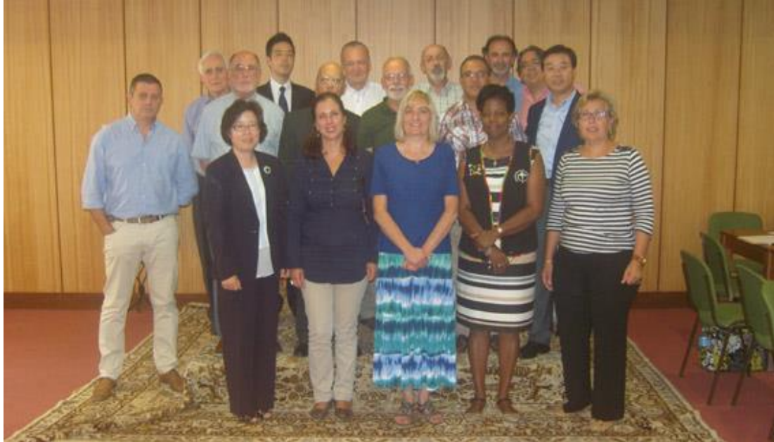
Participantes en el encuentro internacional del OMCC

El boletín del OMCC (desde enero de 2015) será mensual y contará con la participación de cada uno de los Grupos Internacionales de conformidad con el calendario establecido que envió en anexo;