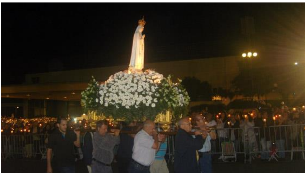
Fátima – Procesoión de velas

Septiembre fue un mes muy importante para la Organización Mundial y para todo el Movimiento, pues que en Fátima, los días 12 y 13, estuve una reunión con los Grupos Internacionales donde fueron transmitidas informaciones de gran repercusión y se han tomado decisiones que iran orientando al MCC en los próximos años.