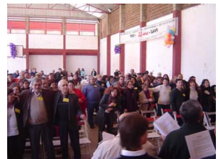
Ultreya Aniversario de la Arquidiócesis de Resistencia.