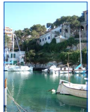
Imagen de Cala Figuera

Este número tiene un formato especial, en él hemos querido dar cabida a un pequeño texto de los representantes de FEBA nombrados oficialmente a día de hoy (aunque en breve serán más) para que nos puedan presentar sus objetivos y expectativas.